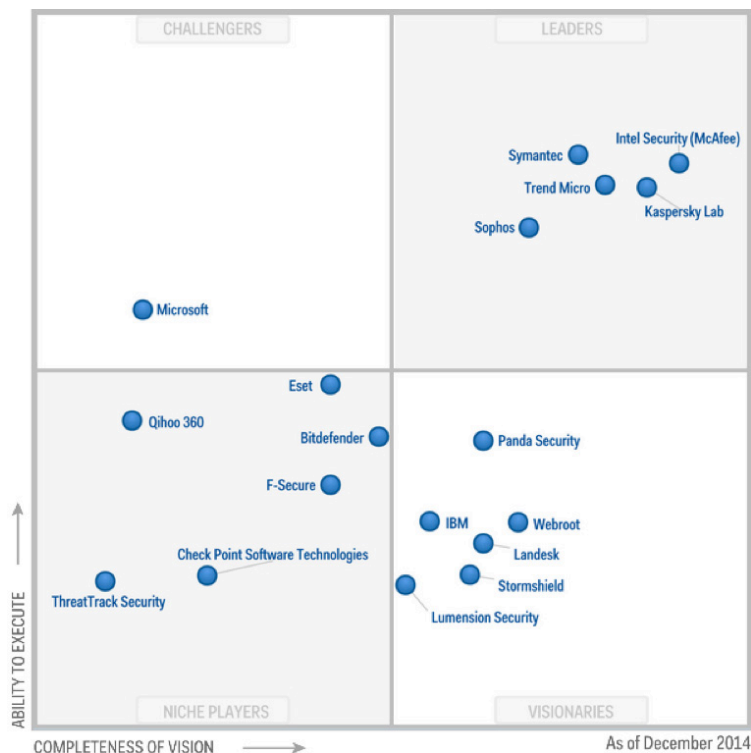
Magic Quadrant für Endpoint Protection Platforms von Peter Firstbrook, John Girard, Neil MacDonald, 22. Dezember 2014

Im Gartner Magic Quadrant für Endpoint Protection Platforms, der die Vollständigkeit der Lösungsangebote sowie die Handlungsfähigkeit verschiedener Anbieter bewertet, wurden 2014 18 Hersteller verglichen. Sophos, Kaspersky Lab, Intel Security (McAfee), Symantec und Trend Micro konnten sich im Leader Quadrant platzieren. Sophos ist zum achten Mal in Folge Leader.